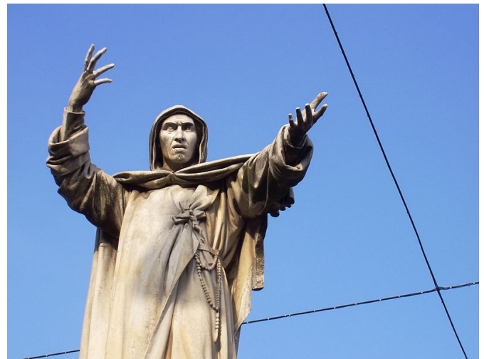
Estatua de Savonarola en Ferrara.

El papa Alejandro VI amenazó a todos los habitantes de Florencia con la pena de entredicho, que significaba prohibir los sacramentos para todos los ciudadanos e impedir que los muertos se entierren en cementerios bendecidos y provocó así el terror entre el pueblo de Florencia lo cual llevó al pueblo a expulsar a Savonarola. Una vez excomulgado Savonarola, arremetió con aun más contra la corte de Roma y el papa. En 1498 el papa ordenó su arresto y ejecución.