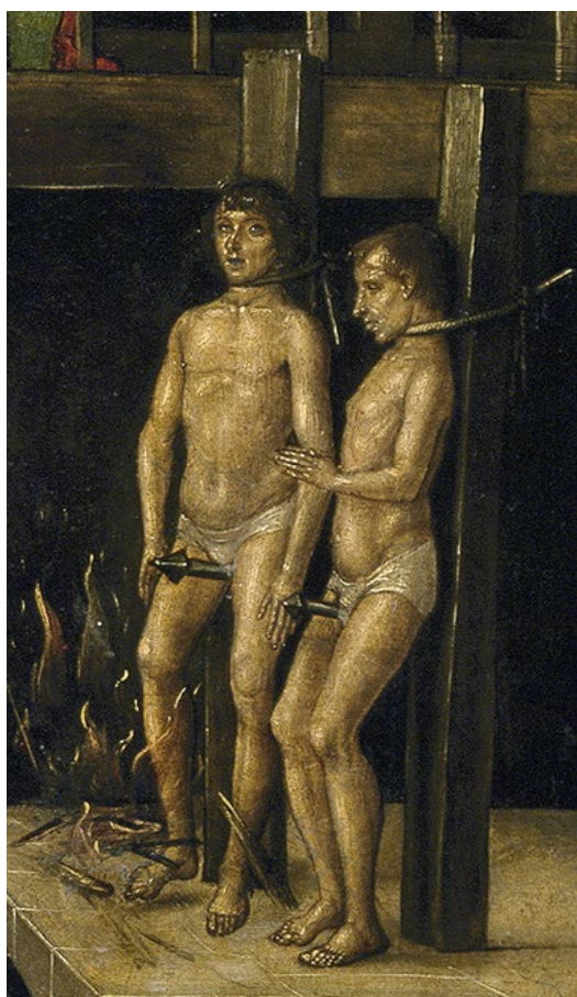
Dos condenados por la Inquisición española siendo ejecutados a garrote vil y quemados por herejes.

5. El máximo castigo era la "relajación". Esto era la muerte en la hoguera. Recibían esta pena los herejes impenitentes . La ejecución era pública. Si el condenado se arrepentía, se le estrangulaba mediante el garrote vil antes de entregar su cuerpo a las llamas. Si no, era quemado vivo. Los casos más frecuentes eran los de que, bien por haber sido juzgados in absentia , bien por haber fallecido antes de que terminase el proceso, eran quemados en efigie.