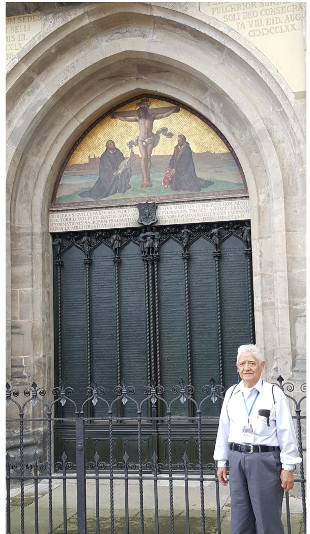
Puerta de la iglesia en Wittemberg donde se clavo las 95 tesis.

El Papa advirtió a Martín Lutero el 15 de junio de 1520, con la bula Exsurge Domine , de que se arriesgaba a la excomunión, a menos que en un plazo de sesenta días repudiara 41 puntos de su doctrina seleccionados de sus escritos. Cumplido dicho plazo, se rumoreaba que el reconocido y famoso teólogo Católico, Johan Eck había llegado a Meissen con una bula papal de prohibición. En octubre de 1520 Lutero envió su escrito En la Libertad de un Cristiano al Papa, añadiendo la significativa frase: "Yo no me someto a leyes al interpretar la palabra de Dios".